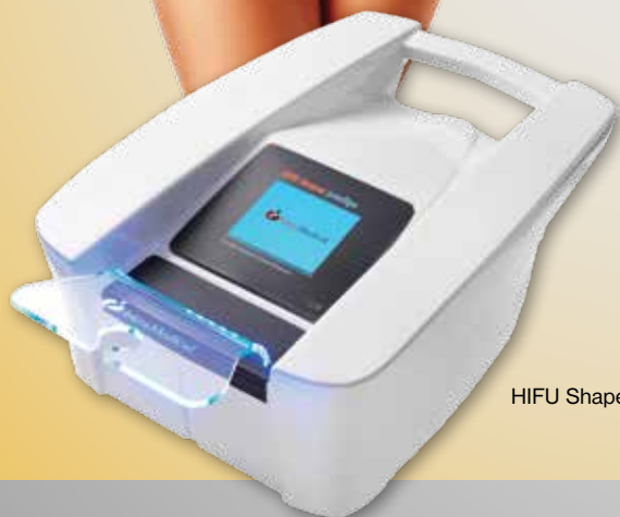
HIFU Shaper prestige