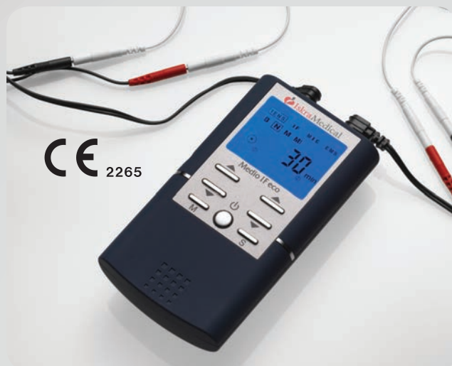
Način rada: TENS • EMS • IF • MIC