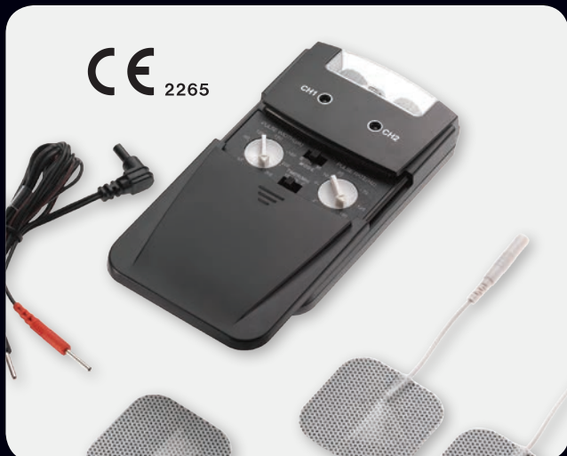
Način rada: TENS