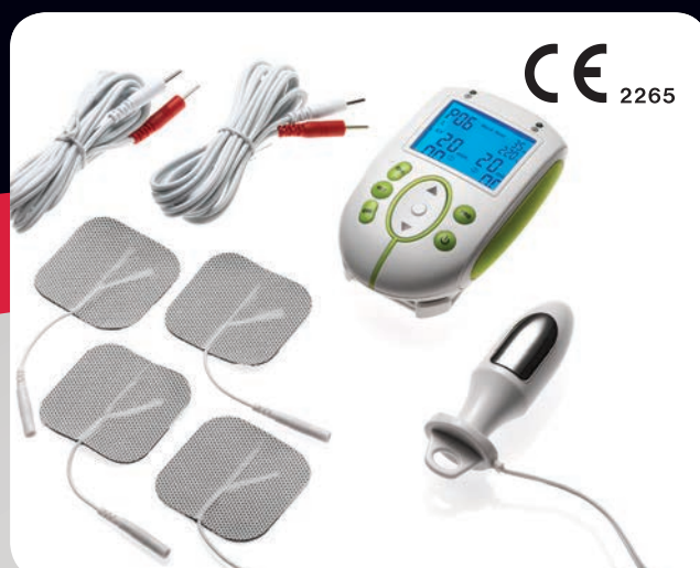
Način rada: Inkontinencija • TENS