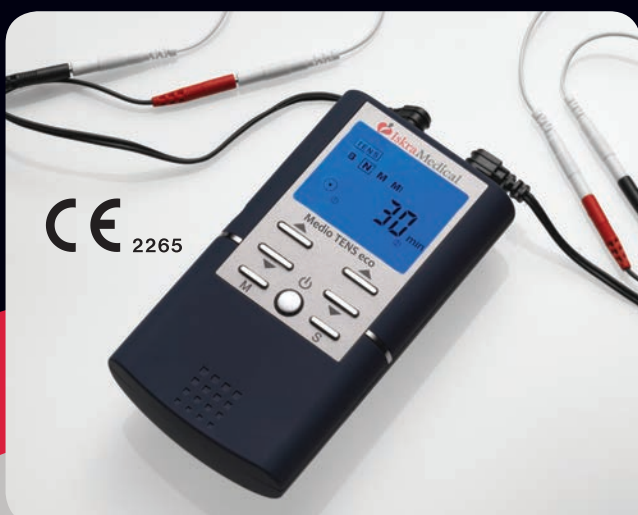
Način rada: TENS