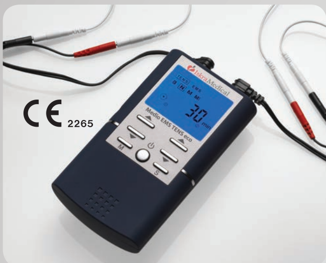
Način rada: TENS • EMS