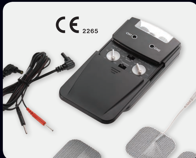
Način rada: TENS